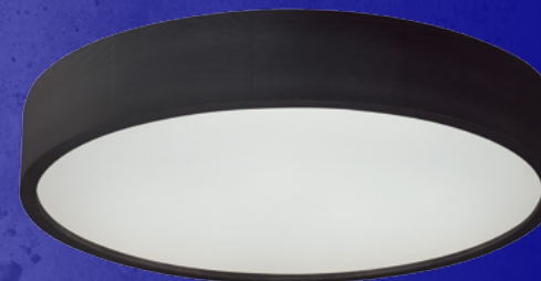
29205 JASMIN 470-B