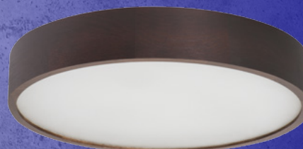
23122 JASMIN 470-WE