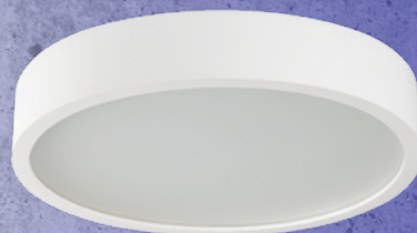
23127 JASMIN 370-W/M