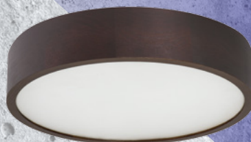
23121 JASMIN 370-WE