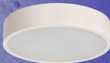
23124 JASMIN 370-W