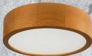
36440 JASMIN 270-G/O