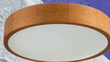
36441 JASMIN 370-G/O