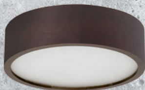
23120 JASMIN 270-WE