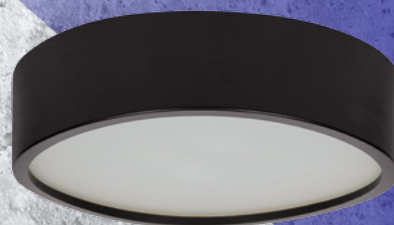
29208 JASMIN 370-B