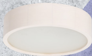
23123 JASMIN 270-W

Modele Kanlux JASMIN w kolorach: dąb sonoma, wenge, złoty dąb z widoczną strukturą drewna.