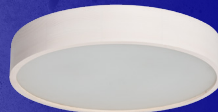
23125 JASMIN 470-W