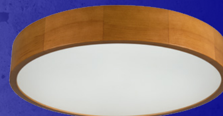
36442 JASMIN 470-G/O