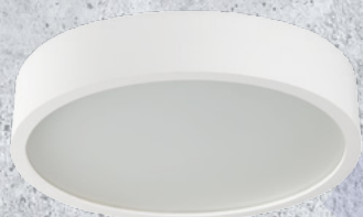
23126 JASMIN 270-W/M

Modele Kanlux JASMIN w kolorach: biały mat i czarny z pełnym kryciem kolorów bez widocznych struktur drewna.