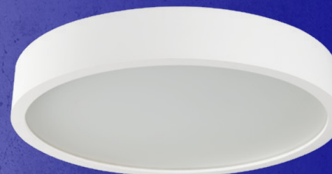
23128 JASMIN 470-W/M