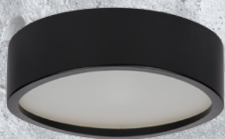
29207 JASMIN 270-B