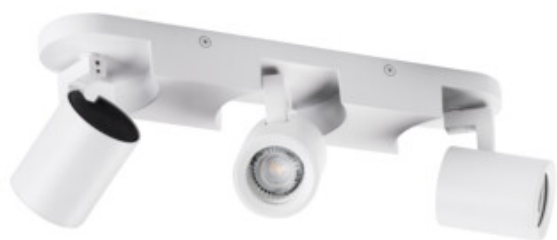
LAURIN EL-3I W