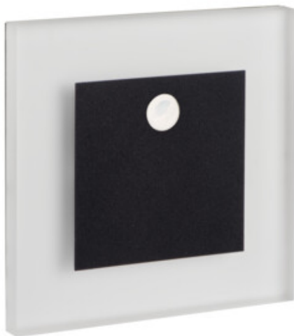
APUS LED PIR B